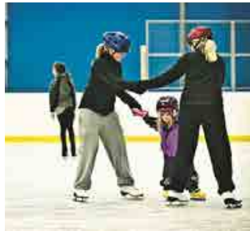
Allmänhetens åkning under hela året.

Alla kan inte bli elitspelare men den sociala verksamheten som Tingsryds AIF bedriver har oerhört stor betydelse. Man fostrar ungdomar till att bli bra samhällsmedborgare. De allra flesta ungdomarna i Tingsryd är skötsamma, här gör TAIF och alla andra fantastiska föreningar i Tingsryds kommun en stor insats. En enda ungdom som det går snett för kostar samhället stora summor varje år samt mänskligt lidande.