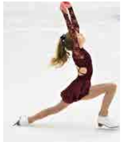
Konståkningen ges bättre träningstider