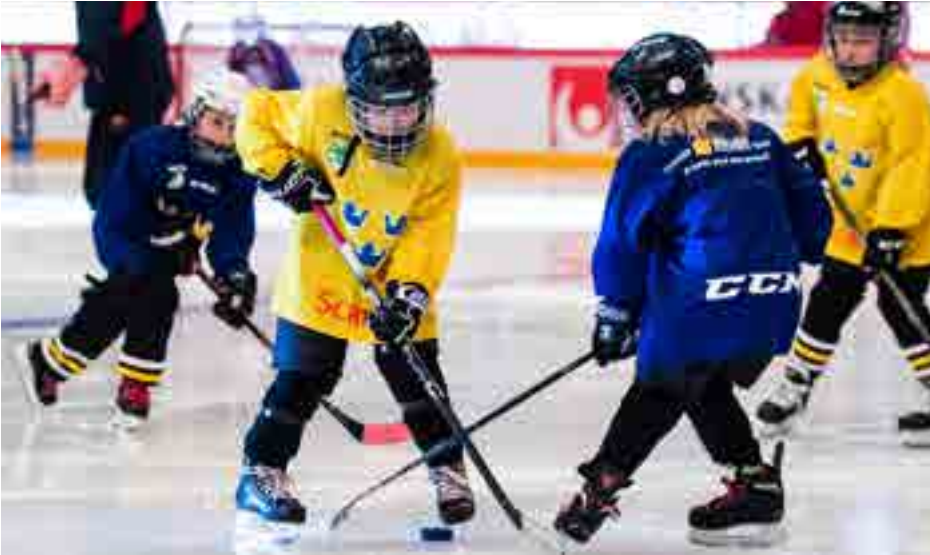
Stora möjligheter att anordna Cuper för pojk- och flicklag samt utökade tider för ungdomarnas hockeyträning.