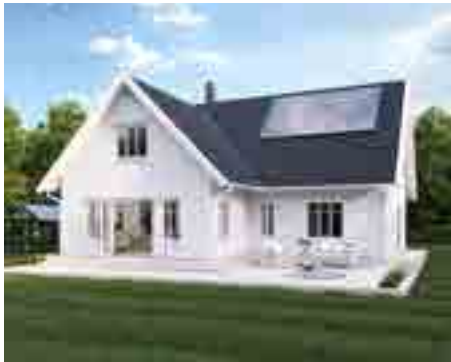
Tingsryd har möjlighet att erbjuda fantasiskt boende nära naturen.

Tingsryd har bästa tänkbara läge med närhet till många regionala städer. Att skapa ett attraktivare Tingsryd (ny arena bl.a) lockar till inflyttning. Man bor och betalar skatt i Tingsryds kommun och arbetspendlar till närliggande orter och städer. En ny trend är att man även kan sköta sitt arbete till stor del hemifrån.