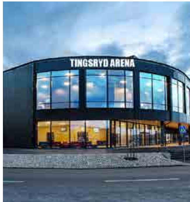
Så här kan Arenan i Tingsryd se ut exteriört.

Arenan blir ett skyltfönster vid korsningen väg 120/27 som är livligt trafikerad. Marknadsföring av matcher syns tydligt från vägen. Informationsskyltarna kan även användas för att marknadsföra evenemang, handel, företag och föreningar i Tingsryds kommun.