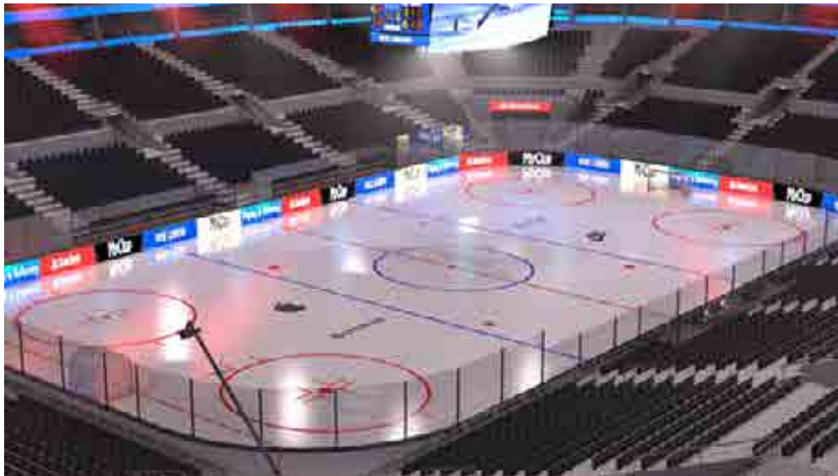
En illustration av hur en framtida arena i Tingsryd kan se ut interiört.