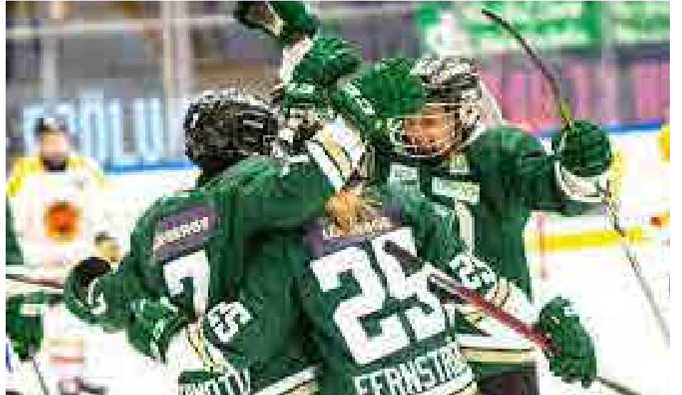
Man kan starta upp dam- och flicklag.

Tillgång till is under hela året gynnar ungdomshockeyn, seni-orhockeyn, konståkningen och allmänhetens åkning.