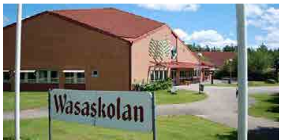
Wasaskolans i Tingsryd