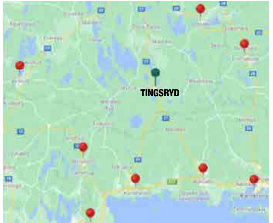
Närheten till många regionala städer för den som vill pendla.

Det är kostsamt att arbetspendla och det har en negativ miljöpåverkan. Det är bekvämt att bo på samma ort som man har sin arbetsplats och man får mer tid över till fritidsaktiviteter tillsammans med familjen.