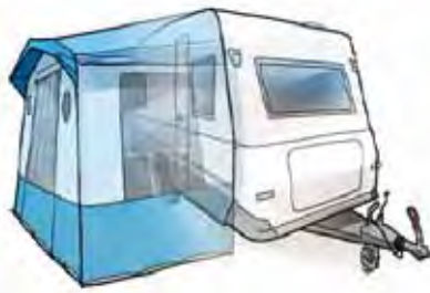
Beispiele von Campingeinheiten.